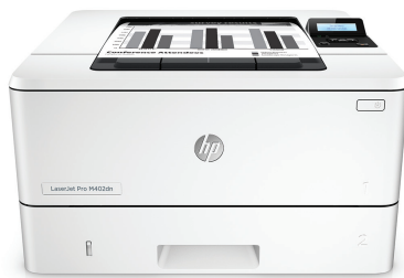
HP LaserJet Pro M402dn

Des performances d'impression et une sécurité renforcée adaptées à votre façon de travailler. Cette imprimante efficace accomplit les tâches plus rapidement et offre une sécurité complète pour une protection optimale contre les menaces. 1 Les toners HP authentiques avec JetIntelligence permettent d'imprimer plus de pages de haute qualité. 2