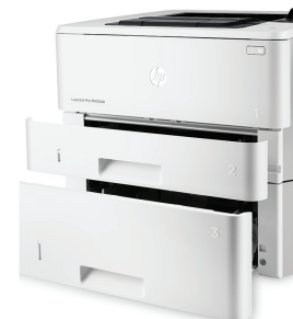
HP LaserJet Pro M402dn avec bac de 550 feuilles en option